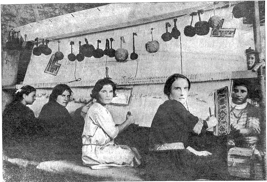
Armenische Mädchen mit der Herstellung von Ceppichen beschäftigt im Waisenhaus von Oropos (Griechenland).