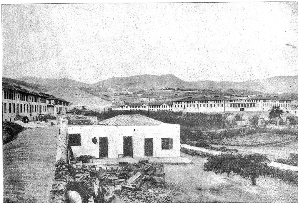
Generalansicht des Waisenhauses des Near East Relief auf der Insel Syra (Griechenland). Im Oktober 1923 waren dort 1250 Mädchen und 950 Knaben untergebracht.

nett und von bedeutender Intelligenz und sie bekennen sich schon seit dem 2. Jahrhundert zum Christentum. Sie gelten im allgemeinen als friedliebend, genügsam und arbeitsam; sie sind die geborenen Kaufleute, und der Geschäftsgeist treibt sie zur Auswanderung in alle Welt. Man fand sie darum schon vor dem Kriege ansässig in fast allen türkischen und griechischen Städten, in Rußland, in Persien und Indien. Durch ihre Intelligenz, ihre Bildung und Geschäftstüchtigkeit bekamen sie maßgebenden Einfluß auf das Bank- und Handelswesen und auf die Verwaltung. Sie spielten eine ähnliche Rolle, wie die Juden sie heute noch in der Finanzwelt spielen.