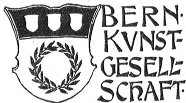
Neues Signet der Bernischen Kunstgesellschaft. Entwurf von Rudolf Minger.

Bei der Entgegennahme der Beiträge wurde Wert darauf gelegt, daß jeder Künstler selbst bestimme, welche Arbeit er abtreten wolle, denn er hatte die Verantwortung für den Wert derselben zu übernehmen. In der Vorschrift, daß nur „eigenhändige“ Arbeiten aufgenommen werden sollten, ist keineswegs eine Zurücksetzung der Graphik zu erblicken.