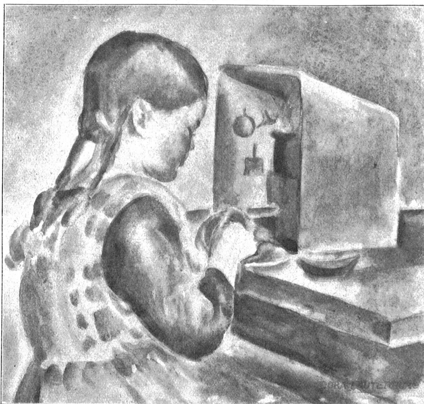
Dora Lauterburg: Spielendes Mädchen, Aquarell. Aus dem Künstlerbuch der Bernischen Kunstgesellschaft.

Das Sammeln graphischer Werke, wie Radierungen, Holzschnitte und Lithographien ist eine Aufgabe für sich. Man