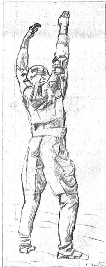
Ferdinand Hodler: Der Schwörende.

trug diesem Bedürfnis Rechnung, indem sie den Künstlern, die Mitglied einer Vereinigung ausübender Künstler waren,