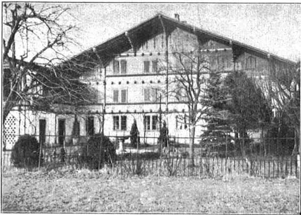
Das Kloßehaus in Chün, in welchem sich Viktor Scheffel in den 70er und 80er Jahren aufgehalten hat.

Außer Schiller ist wohl kein deutscher Dichter in der Schweiz so bekannt geworden, wie der Verfasser des „Effe-