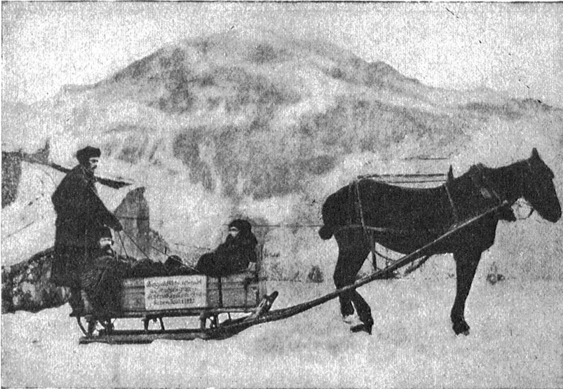
Bergschlitten, wie er über den Splügen und Bernhardin bis 1822 verwendet wurde.

noch sein Weib befragen. Aber dafür war der Spekulant schon gar nicht zu haben.