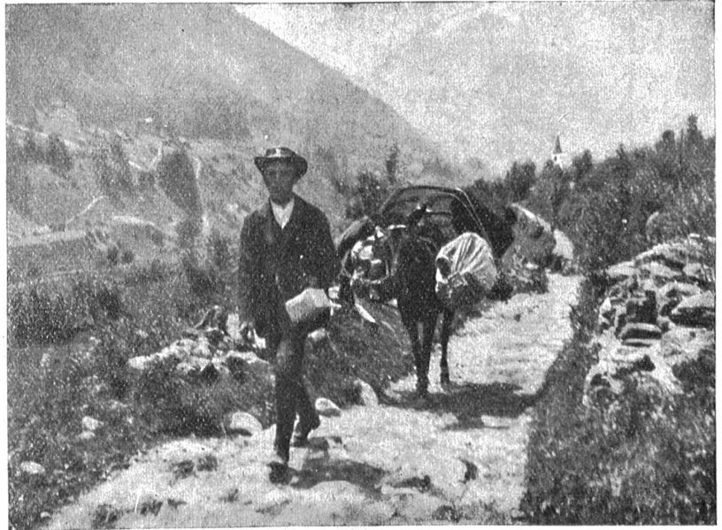
Von der Postbeförderung in der Schweiz. — Grautierpost im Lötschental.

Ganz in sich zusammengesunken saß der Bauer da, das Kinn auf die Hände gestützt, vergeblich bemüht, mit sich einig zu werden. Er mußte einem leid tun in seiner trunkenen Unbeholfenheit. Erst als der Schreiber, zwei