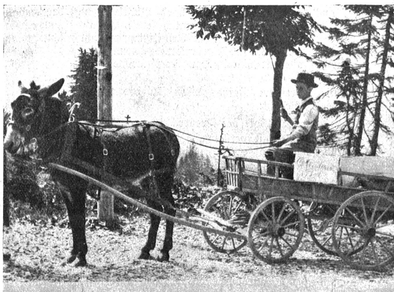
Ottenleue Post (Kt. Bern).

Bewohnern der hochgelegenen Orte die Post. Im Turtmantal, Löttschentel und im Saastal ist der Esel oder das Maultier der Postbote. Im Gebiete des Matterhorns übernimmt im Winter der Bierbeiner die Aufgabe, die die Bahn im Sommer erfüllt. Bei den Barberinewerken zwischen Bernayaz und Châtelard führt ebenfalls im Winter ein Eselchen die Post zu. Und ferner bei Arolla, zwischen Cerention und Bosco und noch an andern hochgelegenen Ortschaften des Tessins. Und doch gibt es Gegenden, wo auch der Bierbeiner nicht mehr gehen kann und wiederum menschliche Arbeit einsetzt, so bei der strengen Jahreszeit beim Postverkehr nach Indemini. Wenn der Winter seine ganze Härte ausübt, dann unternehmen es einige arme Frauen, die Poststücke, und seien sie noch so groß, in die hochgelegenen, weltabgeschiedenen Häuser zu tragen. S. Correvon.