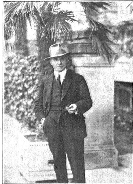
Der dänische Dichter Anker Larsen, Verfasser des „Der Stein der Weisen“.

drucksmöglichkeiten wurde; der Mensch selbst als solcher schien „ausgeschöpft“. Geschickte Epigonen konnten nicht darüber hinwegtäuschen, daß jeder Weg aufhörte. Hamsun selbst