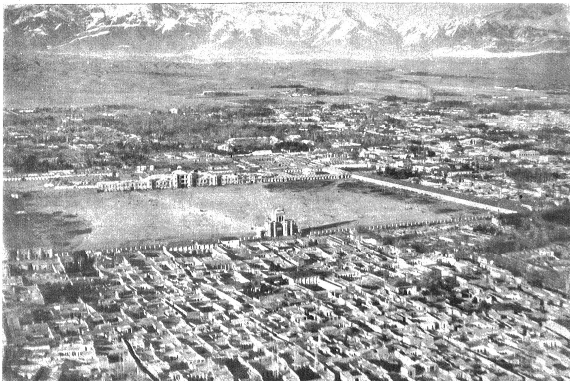
Teheran mit Schemrankette im Norden gegen das Kaspische Meer.

Im Wasserhangar am Zürichhorn wurden dem Flugzeuge in wochenlanger Arbeit die Schwimmer anmontiert und jede Fuge mit Schiffsstift wasserdicht verschlossen. Durch zahlreiche Probeflüge übte sich der Pilot auf seine Maschine ein, bis er sie wie ein Spielzeug sicher handhabte. Erst dann entschloß er sich zur Abreise, die sich auch deshalb verzögerte, weil die Türkei mit der Durchflug-Erlaubnis zögerte, und der Bundesrat keinen Finger rühren wollte, um dem unternehmungslustigen Luffteroberer die Reise zu erleichtern. Schließlich flog er ohne den hochobrigkeitlichen Segen auf gut Glück davon, und ohne die Antwort der Angoratürken abzuwarten. Er mußte dies auch, wenn er es mit seiner Fahrt nicht in die Regenzeit treffen wollte, die ihm im