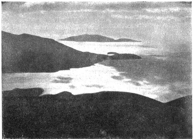
Über den griechischen Gewässern. Im Hintergrund die kahle Berginsel Ithaka, die zweite Heimat Odysseus.

Das Flugzeug, das ihm die Firma zu dem genannten Zwecke zur Verfügung stellte, wurde für die lange Fahrt besonders eingerichtet. Außer einer Menge von Präzisionswerkzeugen, die zur Orientierung in Raum und Zeit notwendig waren, nahmen er und sein Mechaniker Bisegger Gebirgsausrüstungen, Skier, Rucksäcke, Waffen, reichliche Vorräte an Dauerproviant, Photogeräten, Öl und Benzin mit. Das Flugzeug hatte einen besonders starken Motor von 250—280 PS. erhalten, sodaß es auch trotz der großen Belastung von über 7 Zentnern leicht zu manövrieren war.