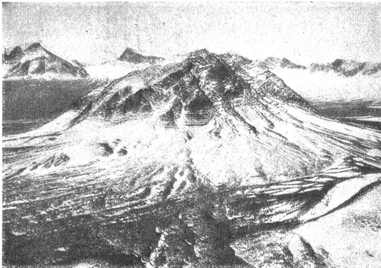
In der Gegend von Isfahan. Berge von etwa 3000 Meter Höhe.