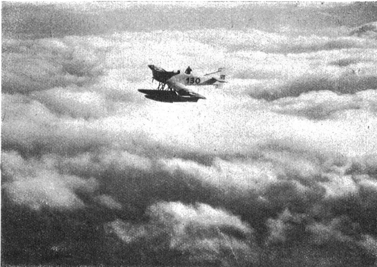
Mittelholzer und Monteur Bisegger (hinten) 3000 Meter hoch über dem Wolkenmeer beim Verlassen der Schweiz.