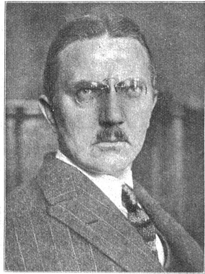
Dr. Hjalmar Schacht, der Direktor der deutschen Reichsbank, Träger der Deflationspolitik, die die gegenwärtige Wirtschaftskrise gebracht hat.

Warschau wird mit dieser Lösung kaum ganz zufrieden sein. Es droht auch schon mit der Abkehr von Genf und mit Anlehnung an Mostau, das natürlich mit freundlichem