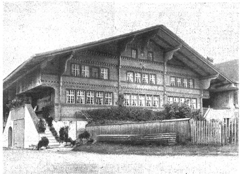
Haus in Wimmis, ein hervorragend schönes Simmentaler Haus, dessen breite fensterreiche Front geradezu imponierend wirkt. Siehe Besprechung S. 159

Der eidgenössische Voranschlag schließt endgültig mit Fr. 297,875,000 Einnahmen und Fr. 322,089,000 Ausgaben, also mit einem Fehlbetrag von Fr. 24,214,000. —