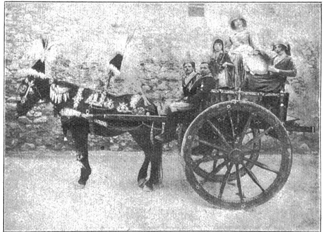
Sizilianische Familie auf ihrem typischen Karren, der in der Woche zur Arbeit und Sonntags zur Ausfahrt benützt wird.