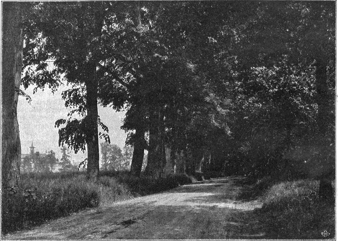
Baumallee Engerstraße (Viererfeld).

Die Broschüre E. Mumenthalers ist mit 25 Alleebildern nach Aufnahmen des Verfassers — wir geben hier einige zur Probe wieder — reich geschmückt. Sie bezeugen eindrucksvoller als eine lange Beschreibung den Wert unserer Baumanlagen. Der Verfasser verdient den Dank der Öffentlichkeit dafür, daß er uns mit seiner