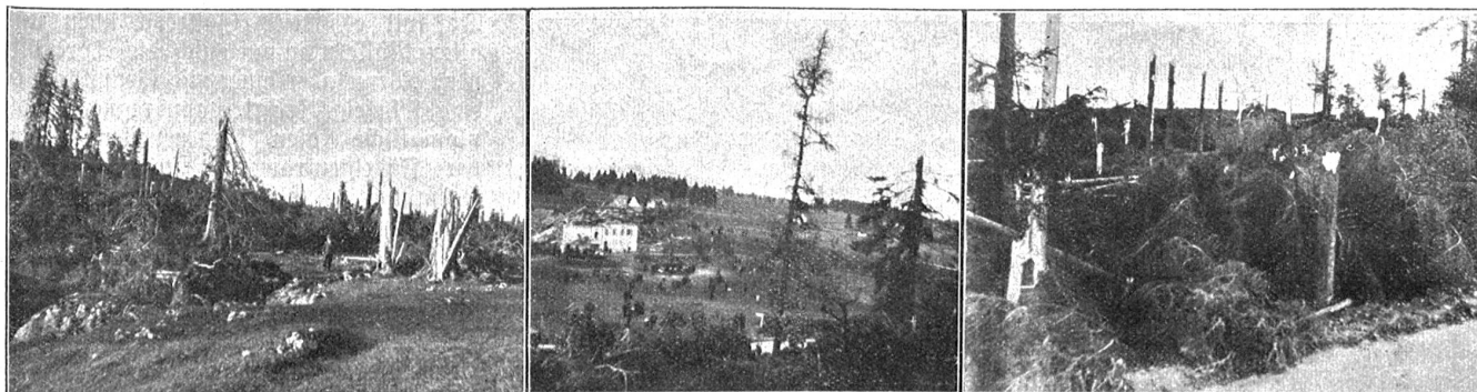
Bilder von den Verheerungen des Zyklons im Jura.

Rechts und links: Verwüstungen in den Wäldern bei Chaux d'Abel. In der Mitte: Bei Haut des Combes.