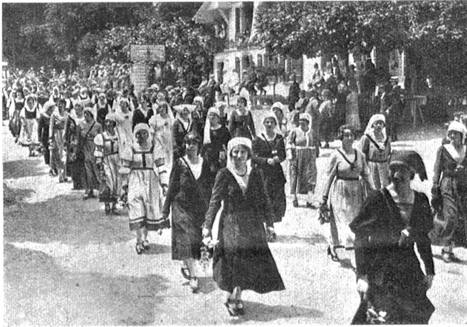
Sestzug: Gruppe der Bürgerinnen, Bäuerinnen und Fischerinnen.

Folgt der Gewaltthaufen: Zürich unter Anführung des ritterlich-stolzen Hans Waldmann, die Berner mit den Schult- heißen Niklaus von Scharnachtal und Petermann von Wabern an der Spitze, die Urner mit Aristier, Schwyzer, die Unterwaldner, Basler, Solothurner und Glarner; die Grenerzer mit ihrem Grafen, die von Chateau d'Ex und endlich eine Gruppe bernischer Lanzenträger, gestellt vom Kavallerieverein Seebezirk.