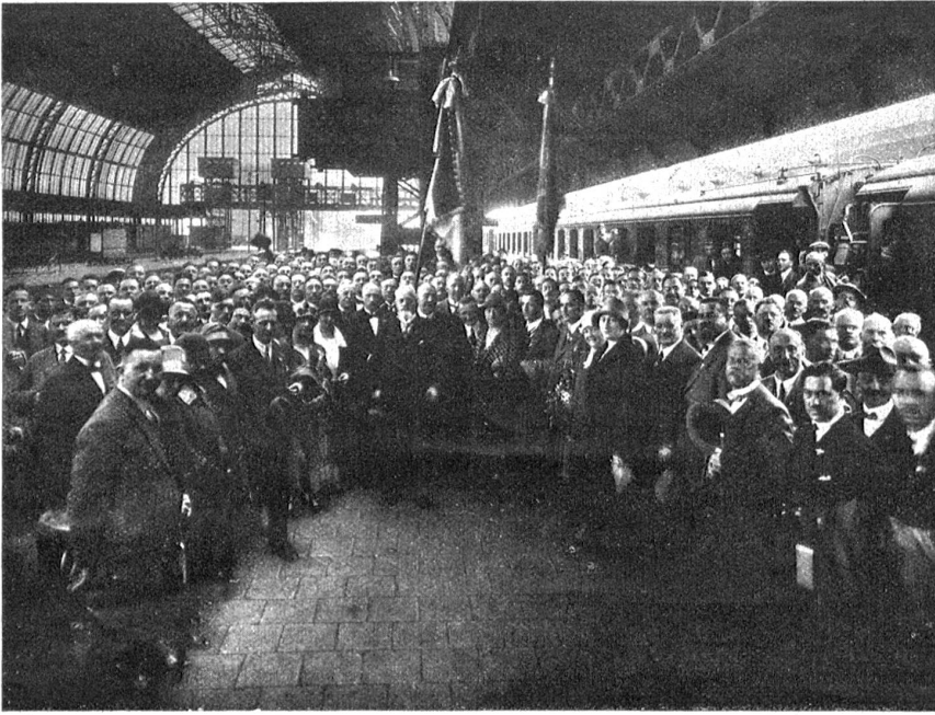
Der Empfang in Amsterdam.