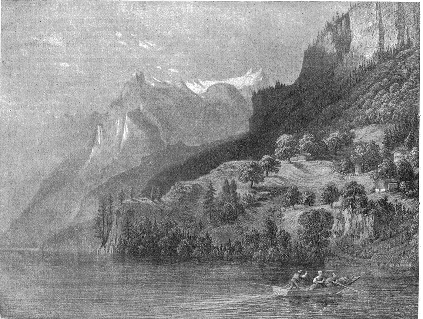
Das Rättli, die Wiege des Schweizerbundes. (Nach einem alten Stich.)

Fortgehen bei der Zeltlegg-Rosine verschworen, man werde sie am Lenzenberg zwei Jahre nicht mehr sehen.