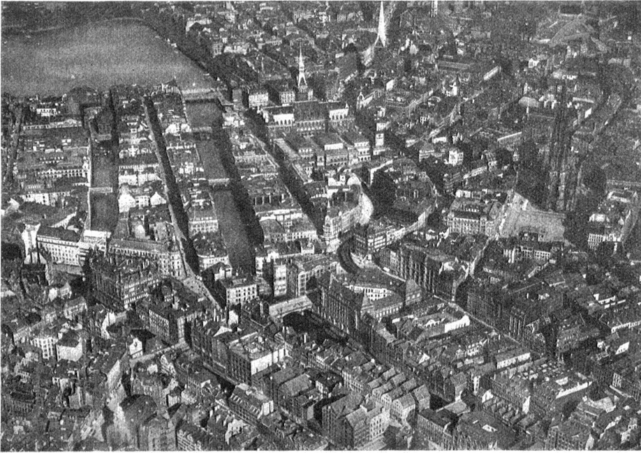
Hamburg mit der Alster (links im Hintergrund). (Vom Flugzeug aus aufgenommen.)

draußen auf dem Platz ein Mechaniker den Motor einer schnellen Prüfung unterzieht. Schon setzt dieser wieder ein und noch folgt die letzte Etappe über die Lüneburger Heide, die in ihrem Frühlingskleid ein schönes Bild gibt. Vom Flugzeug aus gesehen vielleicht für viele etwas trostlos. Doch ich tröste mich und kann hier so recht die Verse Liliencreons verstehen: „Tiefeinsamkeit spannt weit die schönen Flügel, weit über stille Felder aus. Wie ferne Küsten grenzen graue Hügel, sie schützen vor dem Menschengraus. Ermattet ruhn der Hirt und seine Schafe, die Ente träumt im Winsenkraut.... Auf eines Birkenstämmchens schwanker Krone ruht sich ein Wanderfalk aus. Doch schläft er nicht, von seinem leichten Throne äugt er durchdringend scharf hinaus. Der alte Bauer mit verhalt'nem Schritte schleicht neben seinem Wagen Torf. Und holpernd, stolpernd schleppt mit lahmem Tritte der alte Schimmel ihn ins Dorf.“