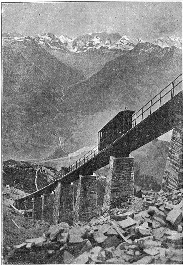
Miefenbahn. — Hegernalpviadukt.

das längere Fernbleiben Deutschlands vom Völkerbund; denn jetzt handle es sich in erster Linie um den europäischen Frieden. Sollte in ihrem Sinne entschieden werden, dann würde sich wohl in der nächsten Zukunft der Genfer Weltbund zum europäischen Völkerbund zurückbilden.