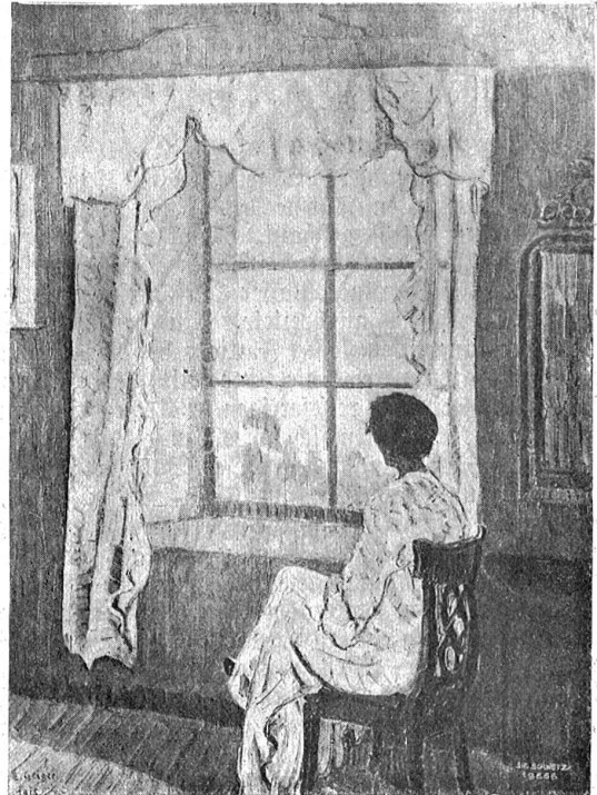
Ernst Geiger Eigerz. — Interieur.

Geschäftig prüft darauf er Masch' um Masche, Und wo ein Schaden sich dem Blicke weist, Seilt ihn die kund'ge Hand. Wie Glorienschimmer