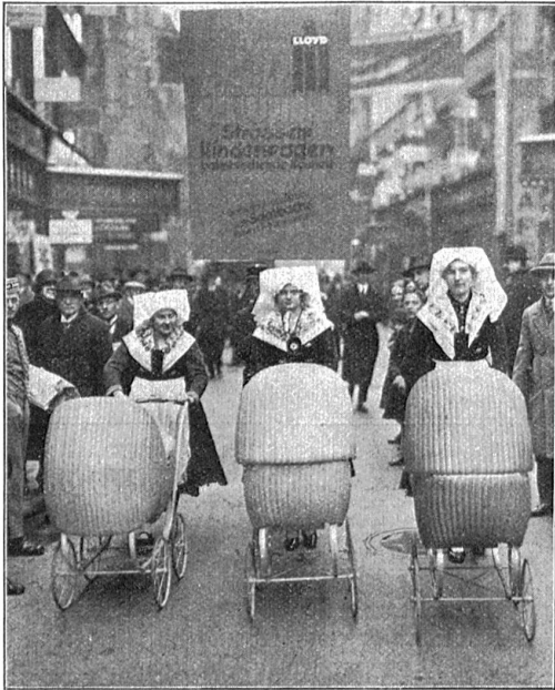
Zur Leipziger Frühjahrsmesse.

lässiger Steuerzahler. In keinem Lande ist die Steuer- verweigerung und der Steuerbetrug so populär wie in Frankreich. Die englische Presse behauptet, Frankreich sei