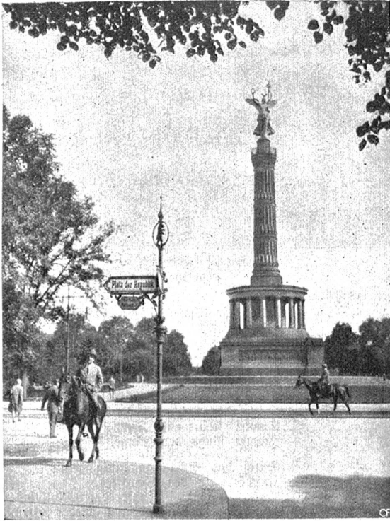
„Place de la République“ in Berlin. Nach dem Vorbilde von Paris ist in Berlin der „Königsplatz“ in den „Platz der Republik“ umgetauft worden. Der Platz mit der neuen „Sirmatafel“.

denen Diktaturen erspart geblieben. Der Vorwand, der Völkerbund sei eine Rückversicherungsinstitution der Siegerstaaten, fällt nun dahin. Ob die Amerikaner nun den Weg