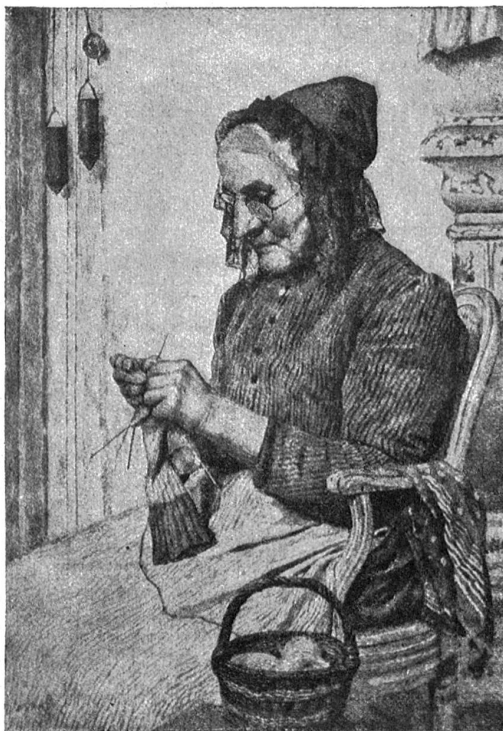
Albert Anker. — Die Großmutter.

dachte, kam ihm das halbvergeffene Sprichwort wieder in den Sinn, das er früher oft von einem Nachbar, dem Serger-Samuel, gehört hatte: „Die Armut frißt dem Glück