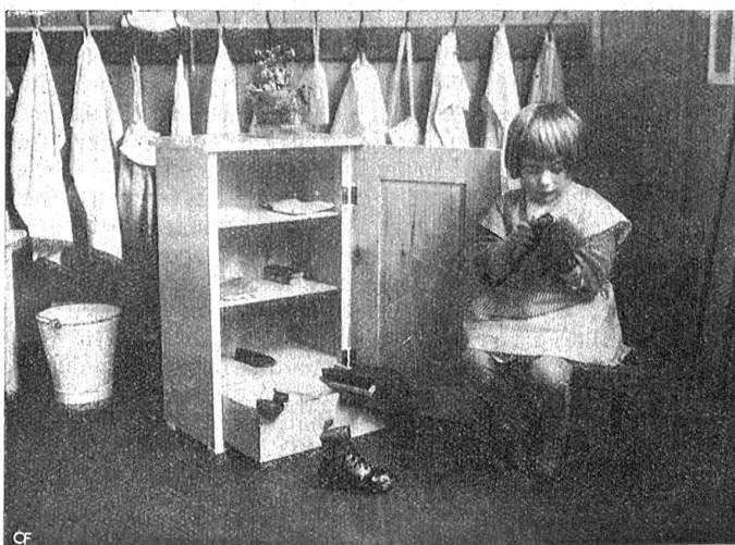
Aus einem Montessori-Kinderhaus.