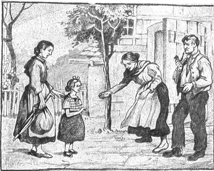
Boscovits: Aufnahme eines Pflegekinde.

Der Ertrag der Dezemberaktion Pro Juventute hilft unter anderem auch mit, daß vielen verlassenen Kindern in guten Pflegefamilien eine neue Lebens- und Erziehungsstätte geboten wird.