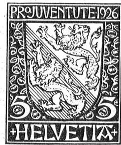
Die vier neuen Pro Juventute-Marken in vierfacher Vergrößerung.

Letztes Jahr wurde für bedürftige Mütter, Säuglinge und Kleinkinder gesammelt; heuer kommt das Geld den Schulkindern und nächstes Jahr den Schülern zu.