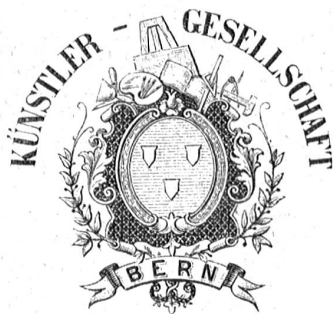
Altes Signet der Bernischen Kunstgesellschaft.

Wie der Gedanke der „Künstlerbücher“ später, im 20. Jahrhundert, wieder neu auflebte, soll noch in einem zweiten Aufsatz gezeigt werden. Dr. J. O. Rehrli.