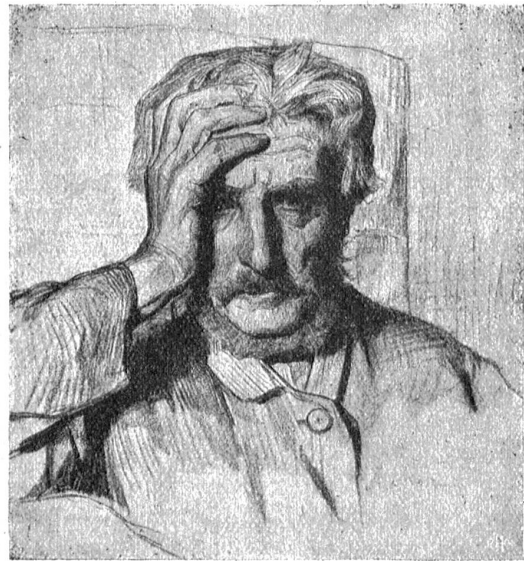
Albert Anker: Studienkopf. (Aus dem Künstlerbuch der Bernischen Kunstgesellschaft.)