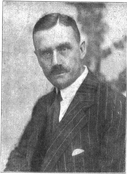
Thomas Mann, der berühmte deutsche Dichter, hielt in Paris einen Vortrag in deutscher Sprache.

Untersuchung deckte dann auch in sensationeller Weise einen bisher verschleierte Vorgang aus den Novembertagen des Jahres 1918 auf. Während den Waffenstillstandsverhand-