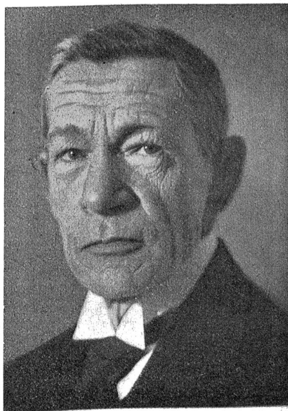
Dr. h. c. Alfred Sarasin, Basel, der neue Präsident der Schweizer Nationalbank.

Vom 15. Mai 1927 bis 15. Mai 1928 wird auf dreißig elektrischen Lokomotiven probeweise das Einmannsystem eingeführt werden. Die Lokomotiven werden auf dem ganzen Netz der Bundesbahnen verteilt werden. Nach Ablauf des Jahres werden die erzielten Resultate überprüft werden. —