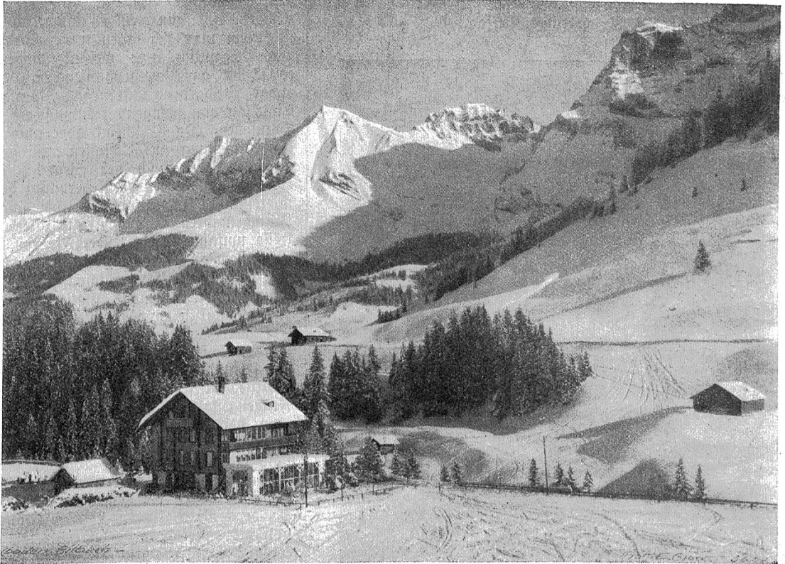
Berglandschaft bei Adelboden.

Der Pfarrer, der vernommen, welch ein böser Streit sich drüben im Obermoos anspinne, versuchte dem Ehezerwürfnis Einhalt zu tun. Er sandte ein Unterweisungskind zu Samuel, ein anderes zu Marianne. Aber Glanzmann ließ ihn fragen, ob wieder so ein Stadtherr und gelehrter Schwächer da sei; dann werde er nicht kommen. Marianne indessen antwortete noch giftiger: „Wenn wieder so ein Gütterlischneder da sei, so möge er gleich ins Obermoos kommen. Da gebe es allerlei zu kosten!“