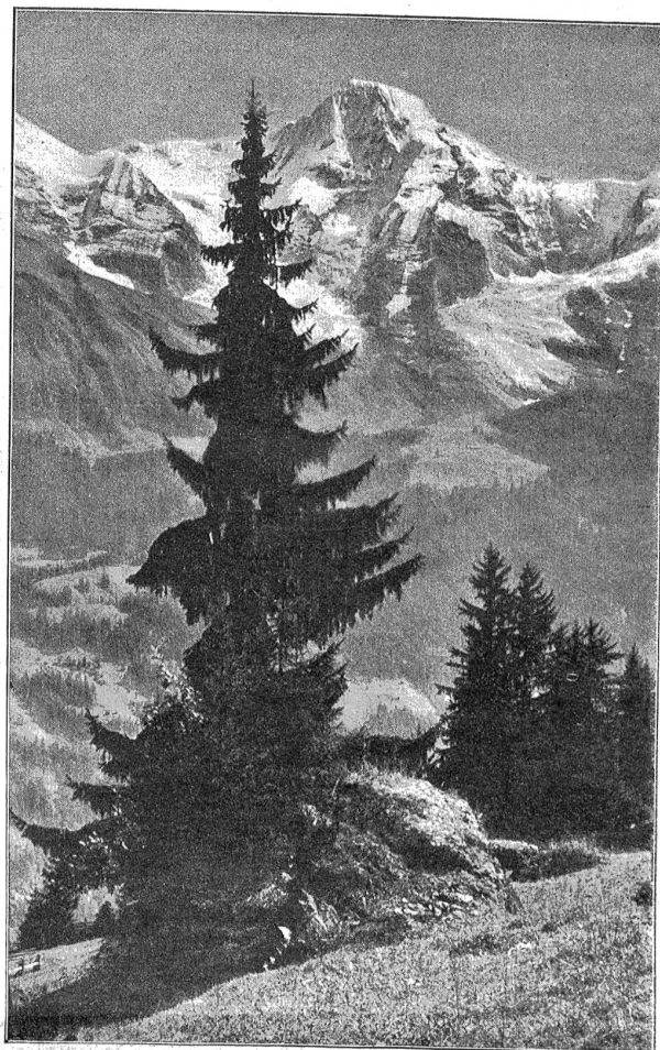
Der Mönch von Mürren aus.