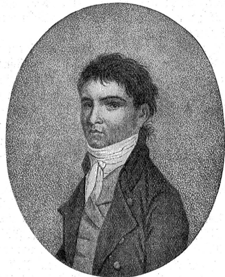
Der jugendliche Beethoven. — Nach G. Stainhauser.

herrlichen „Lied an die Freude“ von Schiller so beseligenden und lebenbejahenden Ausdruck gab!