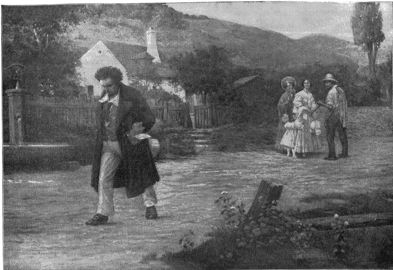
Der einsame Meister. — Nach einem Gemälde von Otto Nowak. (Zum Beethoven-Artikel.)

zu leben! Es gibt heute ein mächtiges Volk, das über alle andern Völker sich erhoben hat und alle ausplündert. Und sein Herr, der über alle gebietet, tut in seinem Uebermut Gewalttat und Frevel. Doch tausendmal schlimmer als das große Kriegsvolk des Kaisers werden die Menschen sein, die in ihrer Sicherheit Gott vergessen haben!“