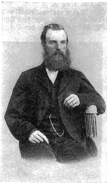
Carl Ruß 1872.

zur Landesausstellung in Genf 1896. Stifter der Alpenklubhütte auf dem Clocher de Bertoll 1896. Gründer der Wohltätigkeitsvereinigung „Für Palästina“ 1896. Gründer der