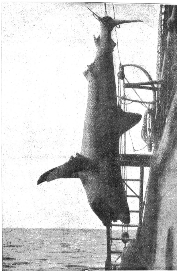
Hai an Bord.

Man näherte sich, der Schiffer schwankte zwischen den