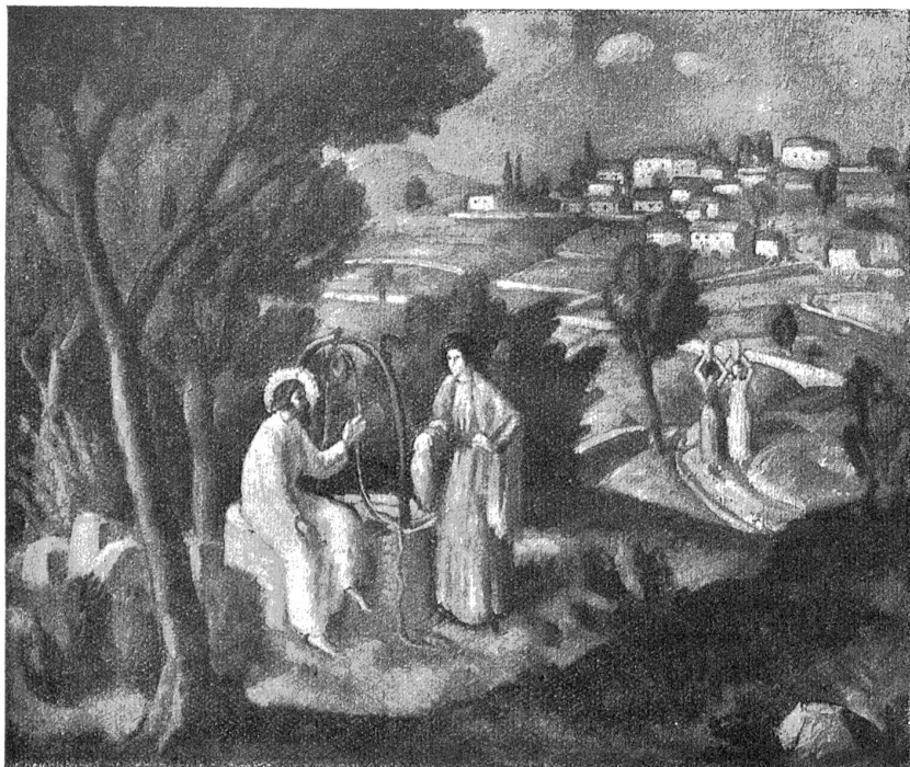
P. Ch. Robert: Jesus und die Samariterin.

Nun endlich erbarmte sich der Wärter. „Wartet einmal, gnädige Herren“, bat er und bedeutete ihnen, sie möchten heraustreten, zog langsam die beiden Türflügel ins Schloß und drückte zuletzt die Klinke mit hartem Ruck fest. Dann legte der Mann seine Rechte auf Glanzmanns Schulter und sprach bestimmt: „Glanzmann!“