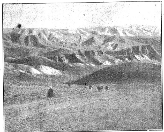
Das unbekannte Afghanistan. — Landschaft roter Konglomerate zwischen Germ-ab und Lar.

Die Eheschließung beruht auf Brautkauf; Vielweiberei ist wenig üblich. Beim Tode des Mannes verbleibt die Frau in dessen Familie und wird gewöhnlich vom Schwager ge-