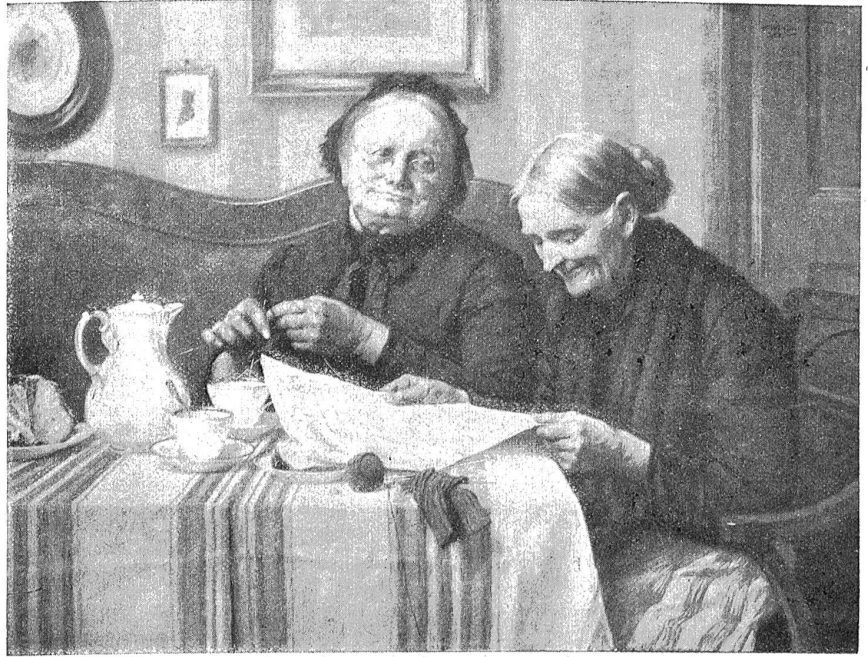
Kaffeestunde. — Gemälde von Walter Witting.

Glanzmann sah sich hilflos im Saale um und rief laut: „Um Gottes und Christi willen! Ich beschwor die