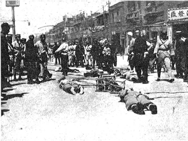
Zu den Ereignissen in China. Massenhinrichtungen auf offener Straße in Shanghai. Die Köpfe der Hingerichteten werden in Holzgestelle getan und als warnendes Beispiel an Straßenmasten aufgehängt.

Frankreichs und damit Europas hängt vielleicht mehr als wir vermuten von der Klugheit und dem Geschick der führenden Männer ab.