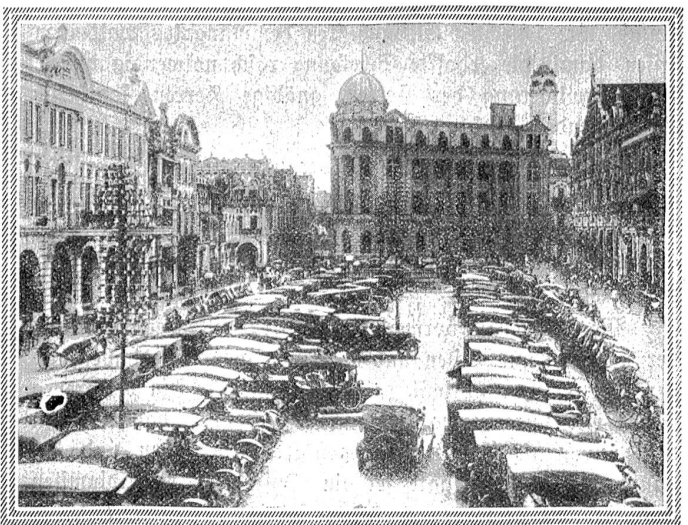
So sieht es in Hinterindien aus! Autoparkplatz auf dem Hauptplatz in Singapore. Die Romantik des Ostens schwindet mit der Zivilisierung im europäischen, im amerikanischen Sinn

Kirschen erbeutete er auf seine besondere Weise: er ging auf den Markt mit einem an einer Schnur festgebundenen lebenden Krebs unrechtmäßiger Herkunft. Wenn er in der Nähe der Obststände vorbeistrich, nahm er die erste Gelegenheit wahr, ob die Händlerin nicht aufpakte, schleuderte den Krebs von weitem auf einen Korb und schnellte ihn zurück mitsamt den purpurnen, in den Scheren festgehaltenen Früchten. Die Obsthändlerin schimpfte natürlich, mußte aber in den meisten Fällen selber lachen. Wurde sie jedoch ernst-