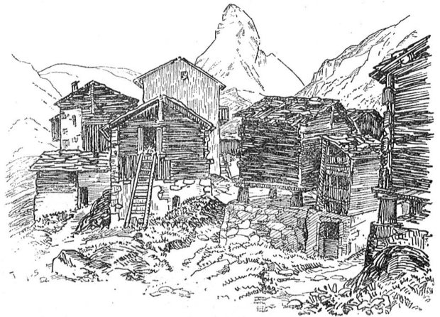
Das alte Zermatt.

Handwerksburschen durch das Wallis ziehen und — kommst du mal ins Vispental, dann mach die Augen auf und staune.