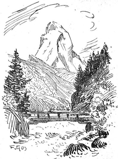
An der Matter-Visp.

Kommst du mit der Berner Alpenbahn von Bern her durch den Lötschberg ins Wallis, so nimmt es dich schon mit seiner wahrhaft heroischen Landschaft gefangen und wenn du Brig und Visp gesehen hast, so weißt du — das ist Wallis. Diese Städtchen im offenen sonnigen Rhonetal vereinigen in sich alles: Sonne, Wein, Berg und Tal, Singen