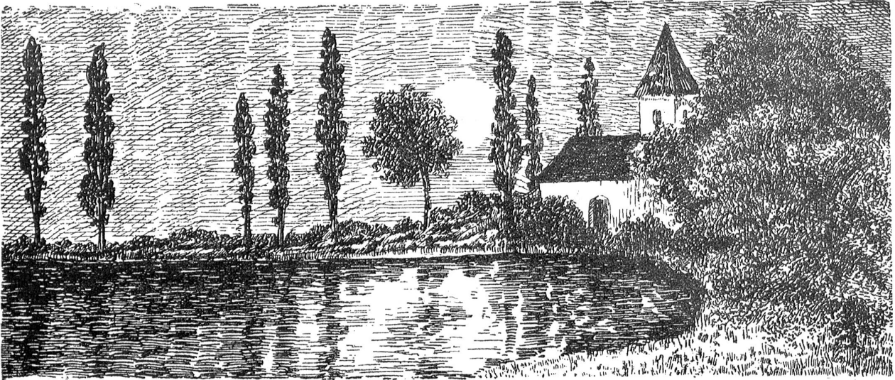
Olga Amberger: Mondnacht.