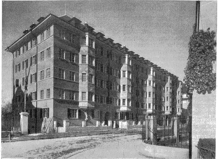
Wohn- und Geschäftshäuser an der Optingenstraße. — Architekten: Hans Weiß und Steffen & Studer, Bern.

Für den modernen Architekten gibt es ästhetische Gesetze ringsum. Die örtliche Tradition, der genus loci , will berücksichtigt sein; aber auch die Gegenwart mit ihren eigenen Bedürfnissen und Notwendigkeiten muß zu ihrem Rechte kommen. Der heutige Architekt muß vielfach mit bescheideneren Baumitteln auskommen als der der Vergangenheit;