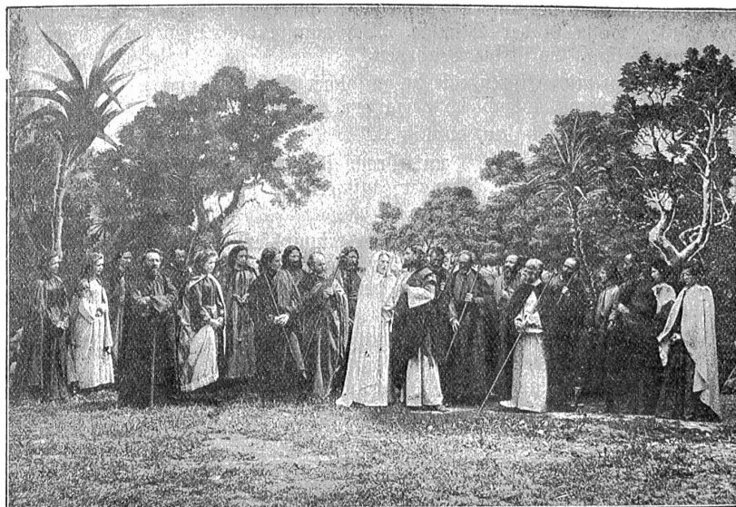
Passionsspiele Selzach: Der Abschied von Bethanien.

Wer hingehet, bereut es nie; es ist eine Erinnerung fürs ganze Leben.