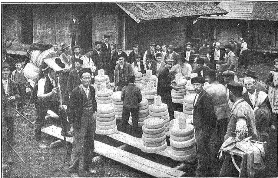
Kästeilet im Jufstual.

Im blauen, kühlen Schatten liegen noch immer die Hütten, die budlige steinige Wiese und die vielen Menschen. Ein geschäftiges Jahrmarktstreiben. Die runden Käsläibe werden sorgsam auf Karren, auf Tragstühle, in Körbe