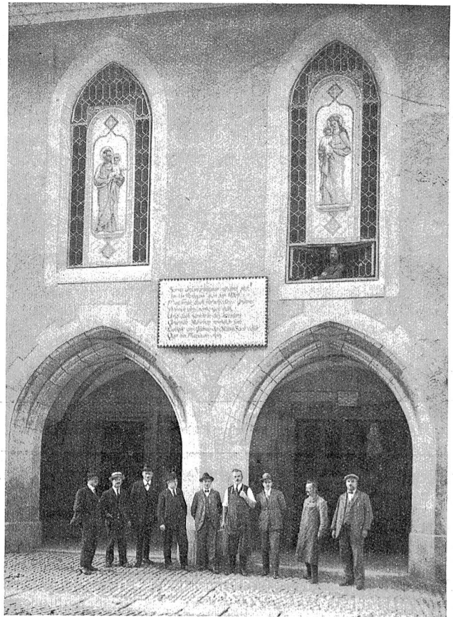
Das ehemalige St. Antonierkloster an der Postgasse in Bern und die Vorstandsmitglieder des heutigen Postgäßleistes.

Die Kirche selbst ruht auf gotthischen Bögen, welche nach bernischer Bauart die durchlaufenden Lauben bilden. Dieselbe ist durch zwei Kreuzgewölbe überspannt und die innere Wand von zwei Eingängen in die Kirche durchbrochen. Zwischen den Kreuzgewölben ist ein Wappenschild mit dem „T“ des Ordens angebracht. In der Arkadenwand zwischen den Türen ist eine kleine Nische zur Aufstellung des Heiligen und des ewigen Lichtes. Dies ist wohl das einzige erhaltene Straßenaltärfchen des alten katholischen Berns. Im Innern der Kirche sind noch Spuren einiger Wandmalereien bemerkbar, die aus dem 15. Jahrhundert stammen dürften. Die jetzigen Balkenlagen sind spätere Zutaten und trugen viel zum Ruin der erwähnten Fresken bei. Alle noch am Gebäude erhaltenen Formen zeigen den Charakter der späteren Gothik. Nach der Reformation wurde die Kirche zu einem Kornhaus umgewandelt, später wurde der Mueshafen dorthin verlegt, noch später diente sie als Postwagenremise und 1839 sogar als Antiquitätensaal. Heute ist sie, wie ebenfalls schon erwähnt, teils Feuerwehrgeschuppen und teils Rumpelkammer.