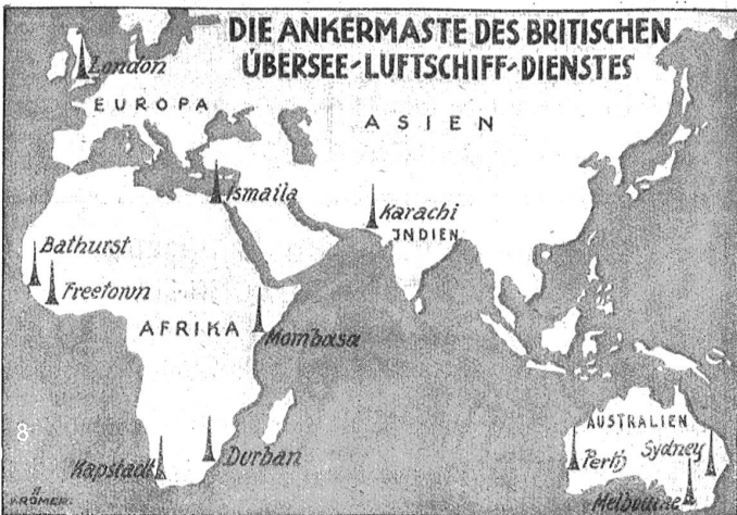
Die Ankermaße des Britischen Übersee-Luftschiff-Dienstes.

Geschmack. Die Schleiereule hielt von jeher wenig auf düsteren Farben Ihr feinhelles Kleidchen mit Perlkupfen darauf, steht ihr vortrefflich. Das heitere Braun gibt ihr ein freundliches Aussehen. Hübsche Seidenstrümpfe bekleiden ihre Beinchen. Dann die „schlanke Figur“, auf der sie offenkundig auch viel hält. Ja so ein Waldkauz ist der reinste Plumpack neben einer Schleiereule. Und erst die großen, glanzvollen Augen. Ja, unsere Eule scheint zu wissen, wie schön diese sind. Durch die feinen, weißen Wimperfedern, den Schleier, werden sie so recht zur Geltung gebracht. Der aufrecht stehende Vogel hebt das Köpchen, neigt es, weiß wie eine dunkel-äugige Spanierin „die Glut eines feurigen Auges“ so recht zur Geltung zu bringen. Etwaige Mängel werden sorgfältig verdeckt. So die Ohren. Da unsere Eule überall hinhören will und die Gespräche des Mäuschen, die Träume der Vögelin belauschen möchte, sind sie nicht gar klein geraten. Aber unter der Frisur ihres Bublikopfes hält unsere Schleiereule sie wohlverborgen.