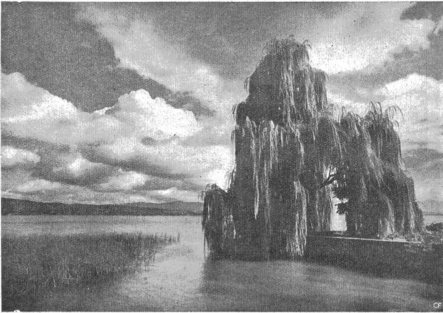
Am Zürichsee.

Seemauer und schaute in die Nacht hinaus. Weithin dehnte sich die Bucht. Die Ufer waren anzuschauen wie zwei lange, mit tausend gelben Lichtpünktchen besetzte, schwarze Arme, welche den See umfaßten. Nur oben mochten sie nicht zusammen. Dort träumten ferne, blaue Berge in Nebelduft. Der Mond stand blank und voll am Himmel und goß in verschwenderischer Fülle sein bleiches Licht auf Land und Wasser aus. Der See war verschlossen, weder Haus noch Himmel spiegelte er. Wie flüssiges Blei bewegten sich die Wellen auf und ab. Eine schöne, gelblichweiße Straße malte der Mond auf dem Rücken des Sees, die funkelte wie Gold und Silber. Weit, weit hinauf in den See führte sie, wurde immer schmaler und schmaler und hörte irgendwo im Dunkel auf. Wo fing sie an? Meine Blicke glitten auf ihr abwärts. Schon am Ufer glitzerten die ersten Gold und Silberfleden, wie mit feinem Pinsel hingemalt. Ein Liebespärrchen saß auf einer grünen Bank vor dieser goldnen Straße. In-