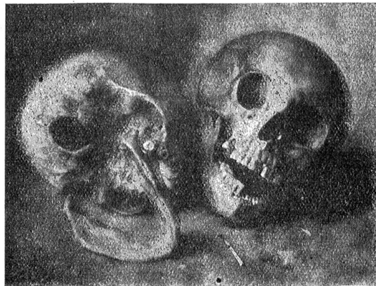
Karl Stauffer. Schädelstudie.

Voll guter Anlagen, die er aus dem gehaltvollen Geist seines Elternhauses mitbrachte, entwickelte sich Stauffer in unbändiger Schaffensglut zu einem raffigen Vollkünstler, der als Radierer zu den Unerfesslichen gehört, als Maler sehr Tüchtiges schuf, als Bildhauer vollgültige Beweise leider unerfüllt gebliebener Entwicklungsmöglichkeiten gestaltete und in bittersten Lebensnöten auch mit dem Wort bewies, eine wie starke Dichterseele in ihm nach Ausdruck strebte. Daß dieses explosive Temperament allzu früh in einem schwer