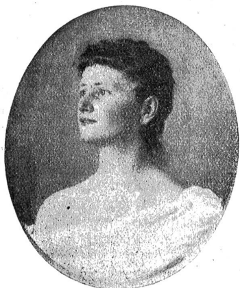
Bildnis der Schwester des Künstlers.