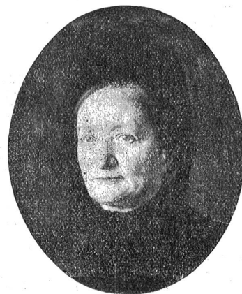
Bildnis der Mutter des Künstlers.