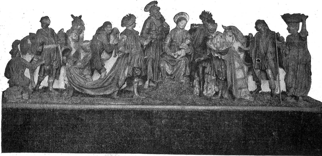
Alte sizilianische Weihnachtskrippe, Mitte des 17. Jahrhunderts.

Figuren aus Holz geschnitten, Kleider aus verflochtenen Stoffen, farbig bemalt.