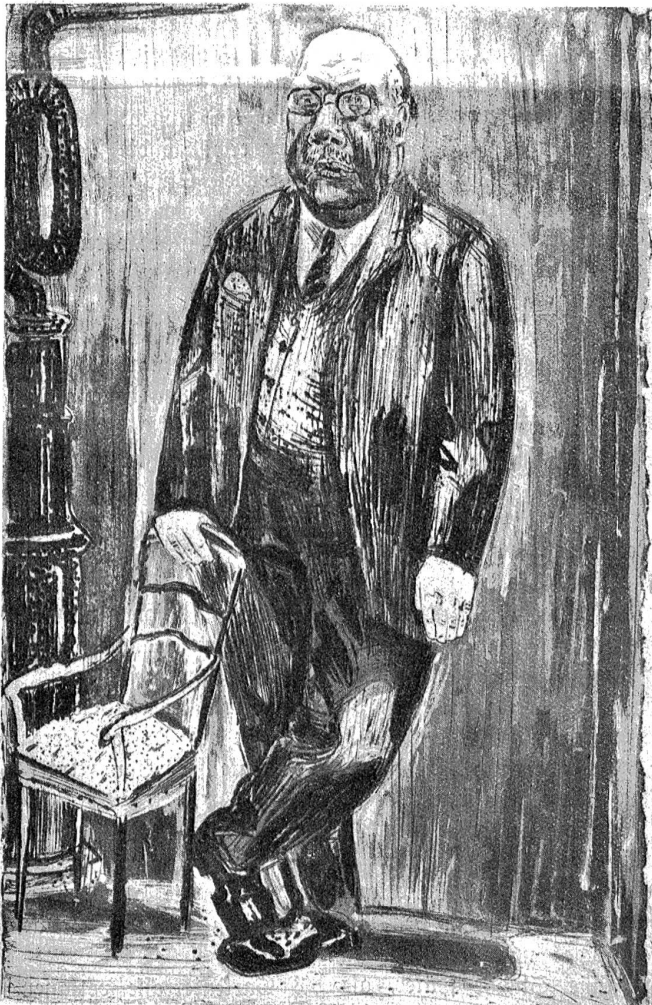
Ausstellung bern. Künstler. — S. Pauli, Bildnis Nat.-Rat. B. (Klischee aus dem Katalog.)

Den Schlager der Versteigerung bildete des Doktors Gummibadwanne. Sie war im Laufe des Nachmittags von vielen Händen berührt, auseinandergefaltet und wieder zusammengelegt worden; ein Spaßvogel hatte sich hineingesetzt