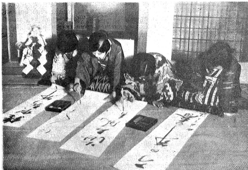
Silvester- und Neujahrsbräuche. Junge Japanerinnen schreiben ihre Neujahrs-Glückwünsche.

Aber auch von Liebe, Ehe, Ernte will man vorauswissen. Aus diesem Drang entstanden alle bis heute gebräuchlichen abergläubischen Handlungen; man beschönigt sie sorgsam durch die Bezeichnung „Spaß“ oder