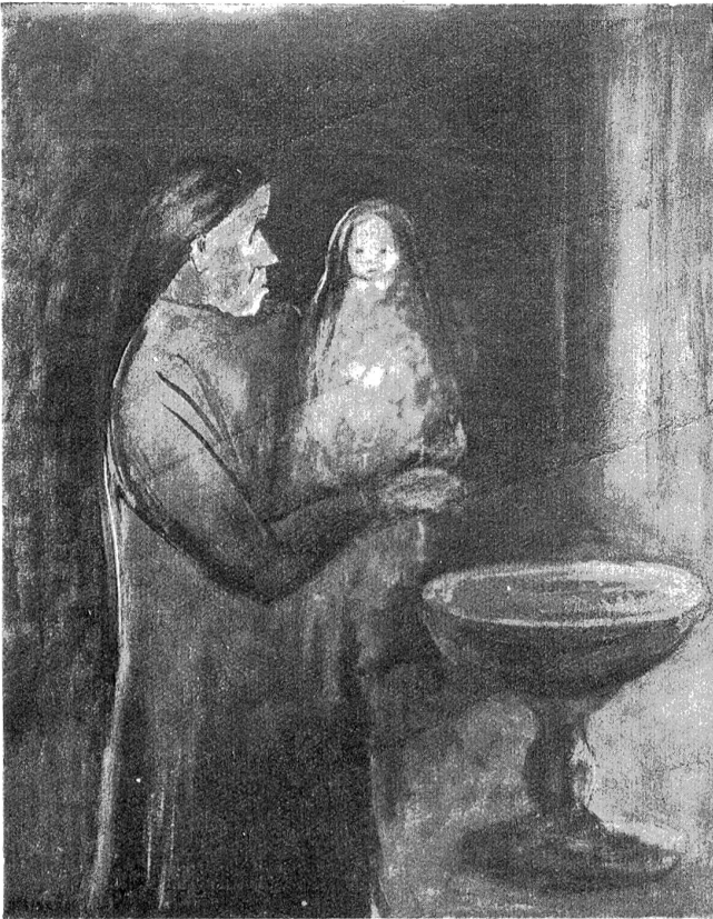
Weltnachtsausstellung bern. Künstler. — E. Morgenthaler, Aus einer Cesiner Kirche. (Kstische aus dem Katalog.)

und darin geschaukelt wie in einer Wiege. Der Notar lächelte, als das Stück auf den Auktionstisch gehoben wurde. Aber wie er eben unter allgemeiner Aufmerksamkeit den Mund zu einer des Gegenstandes würdigen Ausbietung öffnete, geschah etwas Unerwartetes. „Ein Irrtum, Herr Doktor“, rief eine dünne Tenorstimme, und ein Männchen in abgetragener, aber ehrbarer Kleidung — dem Aussehen nach mochte es ein Landschullehrer sein — drängte sich, ein Schriftstück in den Händen, zum Tische vor. „Die Badewanne gehört mir, Herr Doktor, von den Herren Erben mir rechtmäßig zugesprochen.“ Und die unsicher vibrierende Stimme erklärte, wie die Erben des gemeinsamen Vatters ihm, dem entfernten Verwandten, erlaubt hätten, sich dies und jenes kleinere Stück aus dem Hausrat des Verstorbenen nach Bedürfnis auszulesen.