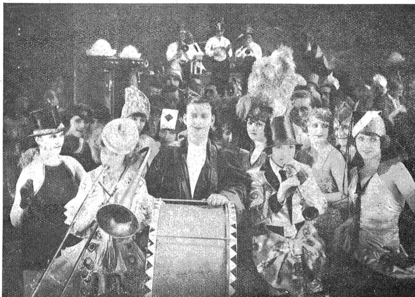
Silvester- und Neujahrsbräuche. Die Pariser ziehen mit Musik ins neue Jahr.

Sternenanruf, Widder- und Stieropfer, Festspiele zu Ehren des siegreichen Gottes Bel-Marduk, endlich der Festzug waren das Wichtigste des Rituals (2000 v. Chr.). An den dramatischen Spielen beteiligten sich König und Priester als Darsteller. Dies ist der Anfang der Mysterienspiele, die unter Calberon ihre Hochblüte erreichten, um in den Aufführungen zu Oberammergau usw. bis in die Gegenwart zu ragen. — Zukunftsbestimmung, aus allerlei Vorzeichen, Essen, Trinken, Carnevalsfreuden; dies zieht sich durch die Jahrhunderte bis auf den heutigen Tag. Die Bräuche der Babylonier blieben nicht ohne Einfluß auf die Juden: infolge der 70jährigen Gefangenschaft. Doch