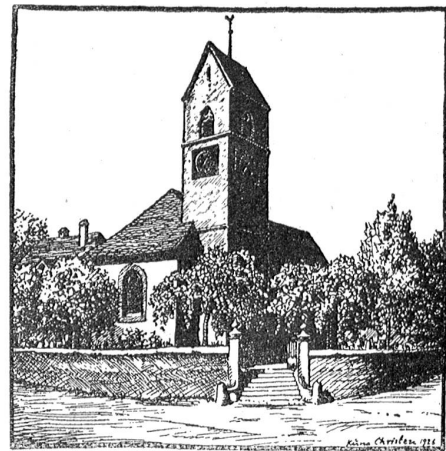
Die Kirche von Rüti bei Büren.

Man unterscheidet fünferlei Fresken: romanische, gotische, frühbarocke, spätbarocke und spätere. Die auffallendsten sind die gotischen. Sie stammen aus den Jahren 1420 bis 1430, was man aus den Gewändern und andern Indizien schließen kann.