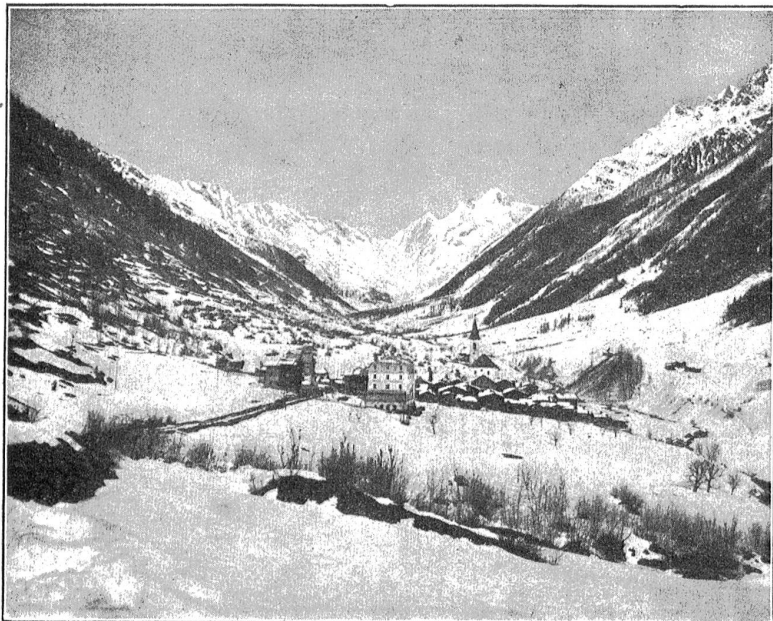
Das Dorf Kippel im Lötschental im Winter. Blick auf den Calthintergrund.

leiden, er wollte nicht widersprechen! Und er konnte begütigend hinzufügen: „Wir wollen den Kindern nicht jede Freude vergiften! Gönn' du ihr einen freien Augenblick und laß sie einmal feiern!“ Solche Begütigung stachelte indessen die Bäuerin zu neuem Zorn auf, und sie enthüllte ihren geheimen Kummer: „Vergiften? Was heißt vergiften? Bleibt uns denn nichts als arbeiten und wieder arbeiten? Wo nehmen wir die Freude her?“ (Fortf. folgt.)