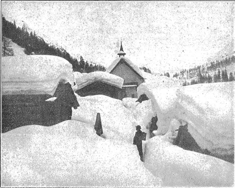
Kühmatt im Lötschental im Winter.