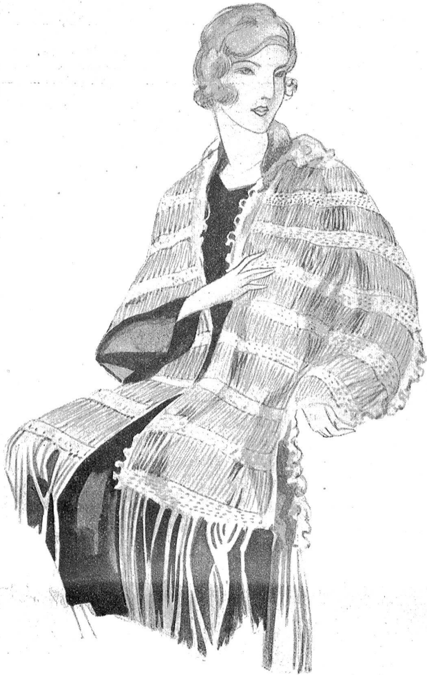
Shawl in Häkelarbeit.