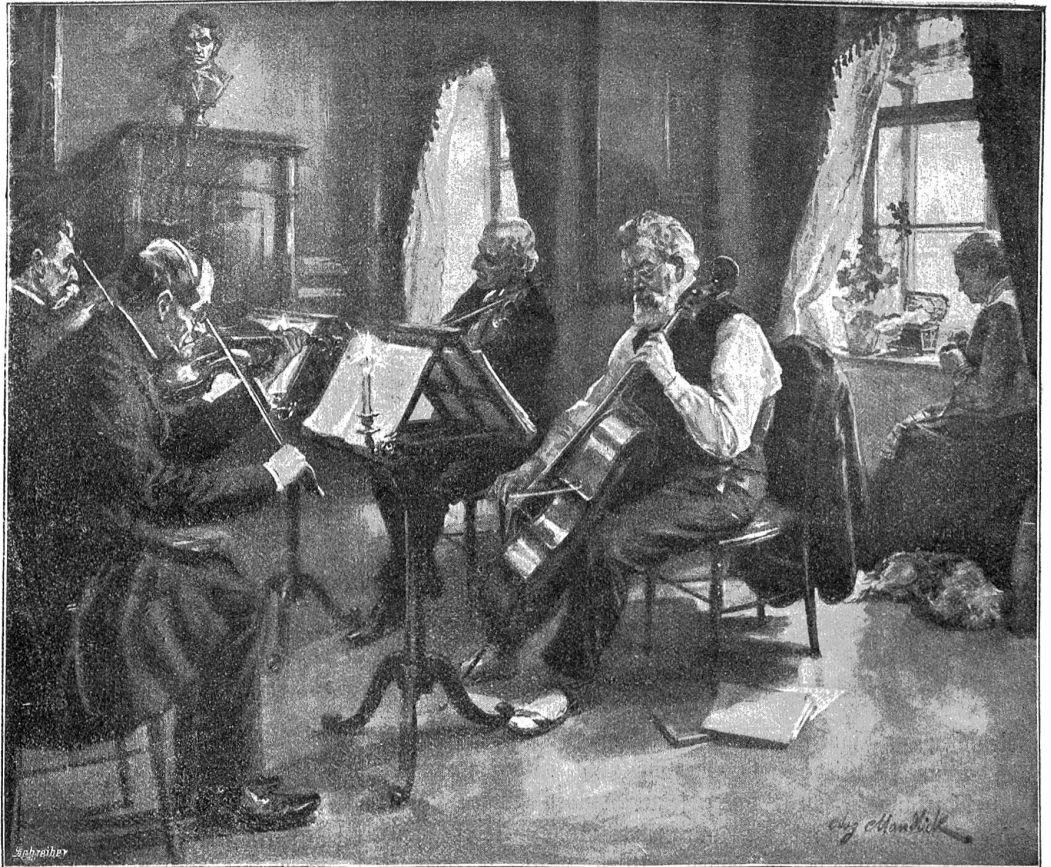
Dilettantenquartett. — Nach einer Zeichnung von Aug. Mandlik (Wien).

Bogt aber blieb mitten in der Stube stehen, die Augen wie von starken und verlockenden Bildern bewegt, und wartete auf ihre Rückkunft. Als sie nun mit Glanzmann eintrat, müsterte er die beiden mit Gleichmut und Kühle, wie wenn die Erregung schon vorüber sei. Marianne schien höher gewachsen zu sein als ihr Mann, in seiner Dunkelheit schien sie sich zu erhellen. Sie nahm Platz hinter seinen Schultern,