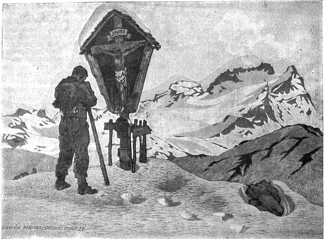
Spätwintertag in der Silbretta.

„Das sage ich dir nicht“, schrie aber Sidney und streckte dem Studenten die Zunge heraus. Das war nun stark. Tante Marie rief entschuldigend: „Er hat zuviel Champagner getrunken“, der Onkel Doktor nahm ihn aber bei der Hand und führte ihn hinaus. Man hörte ein künstlich